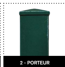
2 - PORTEUR