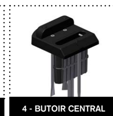
4 - BUTOIR CENTRAL