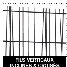
FILS VERTICAUX INCLINÉS & CROISÉS