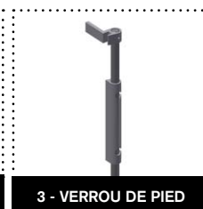
3 - VERROU DE PIED