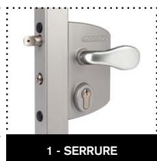
1 - SERRURE