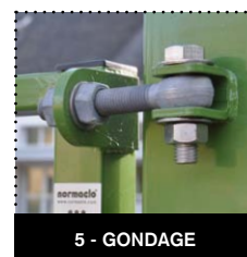
5 - GONDAGE