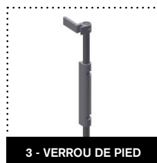
3 - VERROU DE PIED