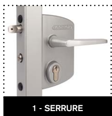
1 - SERRURE