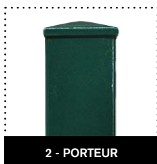
2 - PORTEUR