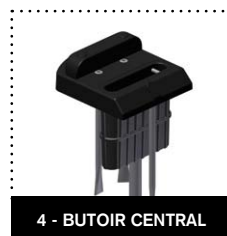
4 - BUTOIR CENTRAL