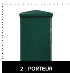
2 - PORTEUR