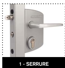
1 - SERRURE