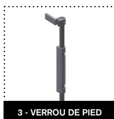
3 - VERROU DE PIED