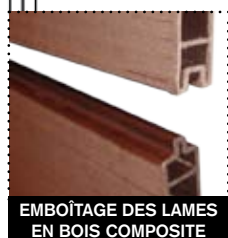
EMBOÏTAGE DES LAMES EN BOIS COMPOSITE