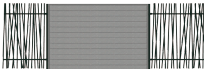
Combinaison CLOWOOD™ et grille OOBAMBOO™