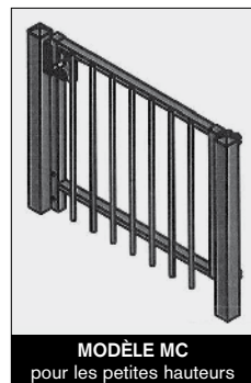
MODÈLE MC pour les petites hauteurs