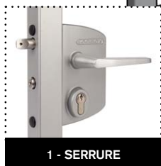
1 - SERRURE